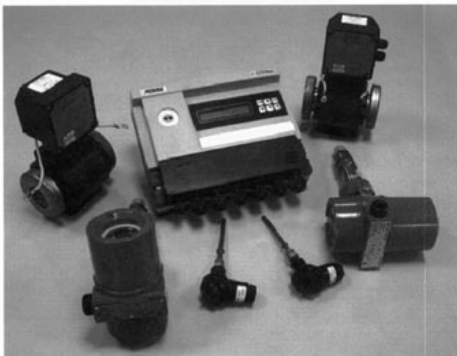
Общий вид теплосчетчиков